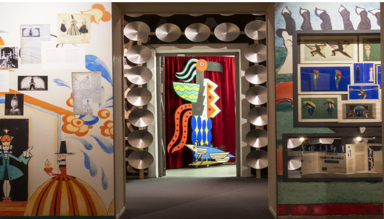
Interiör från utställningen "Om ni inte gillar det kan ni dra åt helvete".