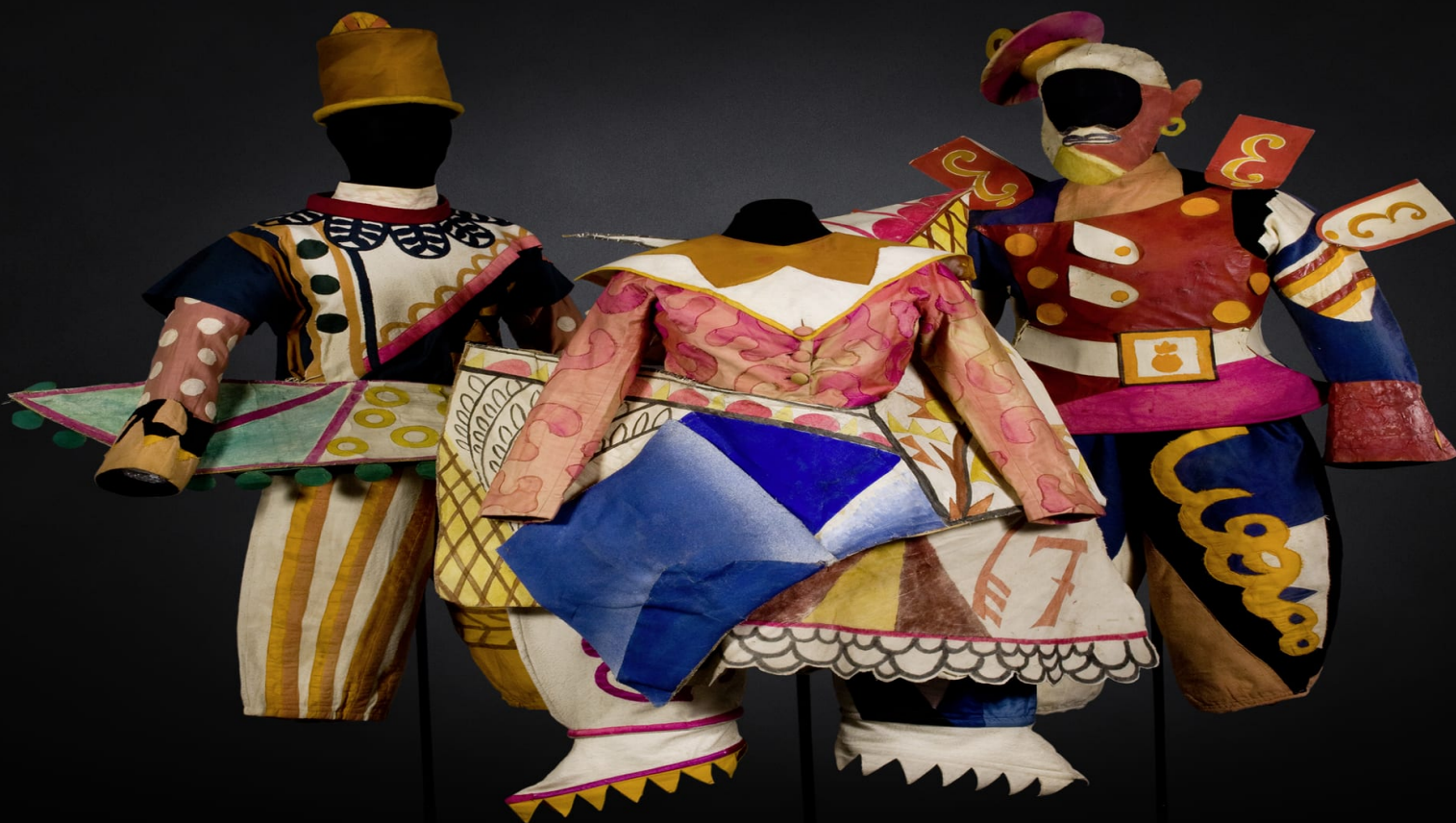
En gycklare, en hustru och en soldat, Ryska Balettens föreställning Chout , 1921. Design Mikhail Larinov