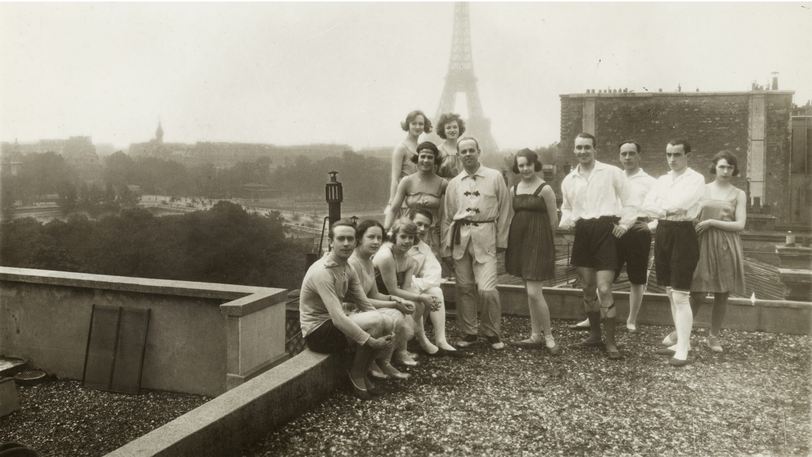
Dansarna på taket till Théâtre des Champs-Élysées i Paris, 1920.